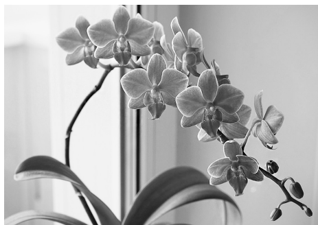
Купленная здоровая орхидея может благополучно расти и хорошо развиваться в магазинном горшке и грунте до года.

Купленная здоровая орхидея может благополучно расти и хорошо развиваться в магазинном горшке и грунте до года. Если растение куплено на распродаже, то чаще всего оно не цветет или заметно ослаблено, что может