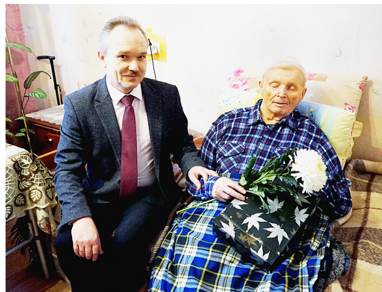
В день воинской славы ветеран принимал поздравления от Главы округа Сергея Лашкова.