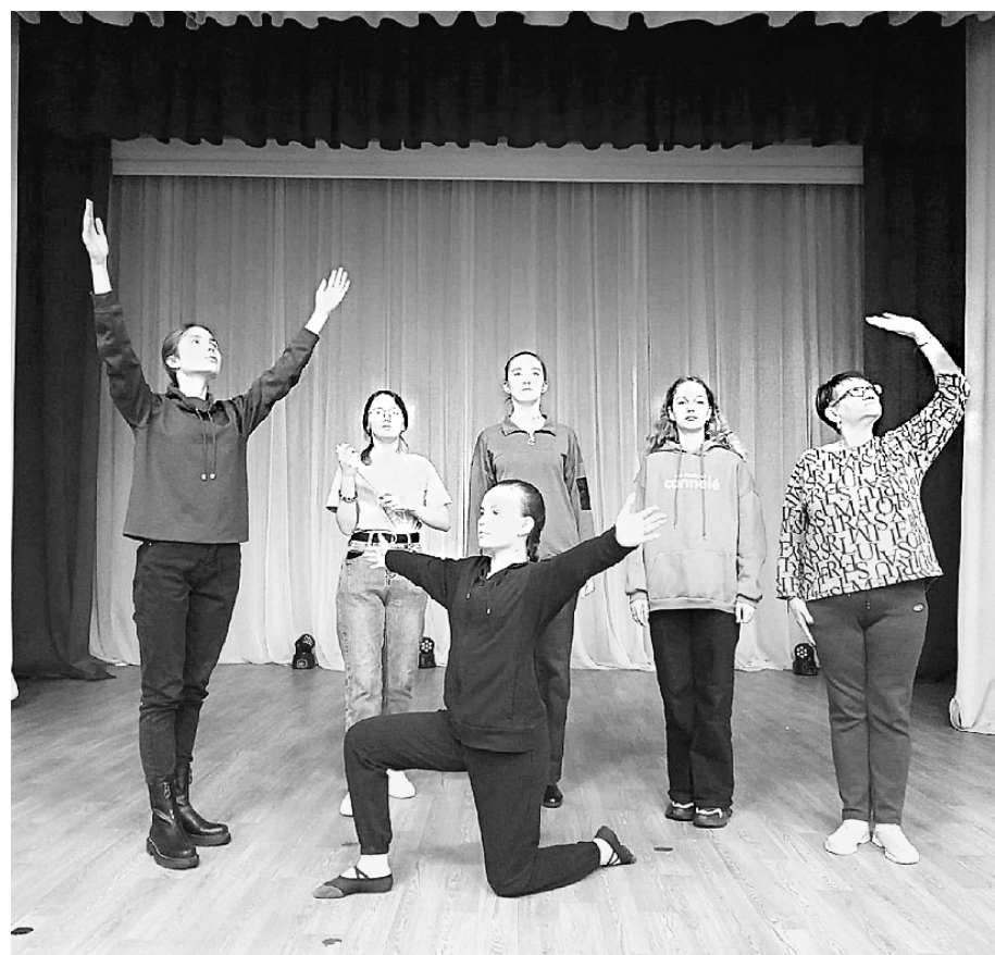
Сейчас коллектив театра ставит литературно-музыкальную композицию по повести Бориса Васильева «А зори здесь тихие». Премьера спектакля планируется ко Дню Победы.