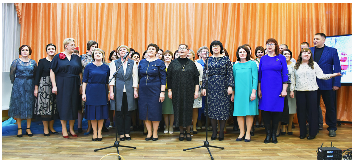
Красивая песня в исполнении коллектива учителей подвела итог юбилейному вечеру.