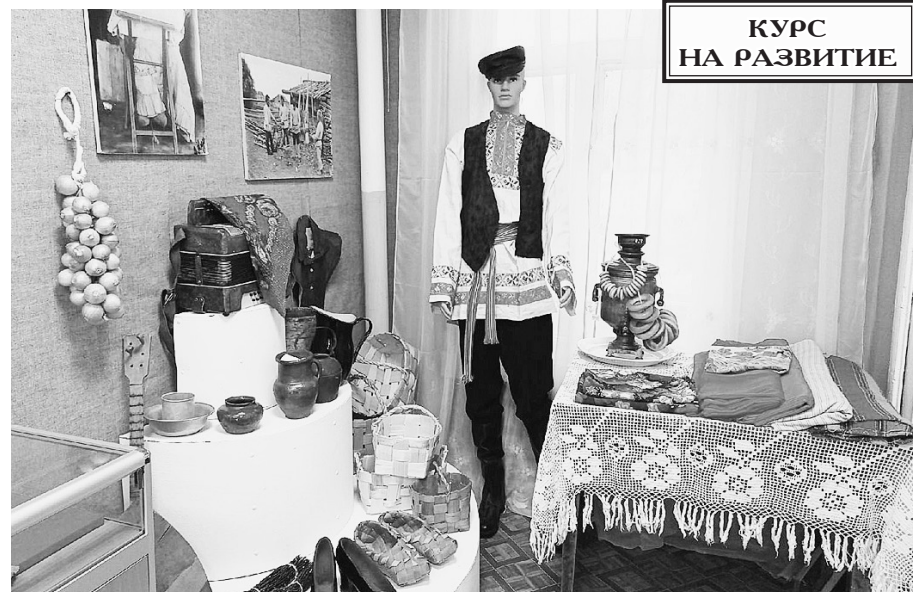
КУРС НА РАЗВИТИЕ

К печати подготовила Ирина МАКАРОВА.