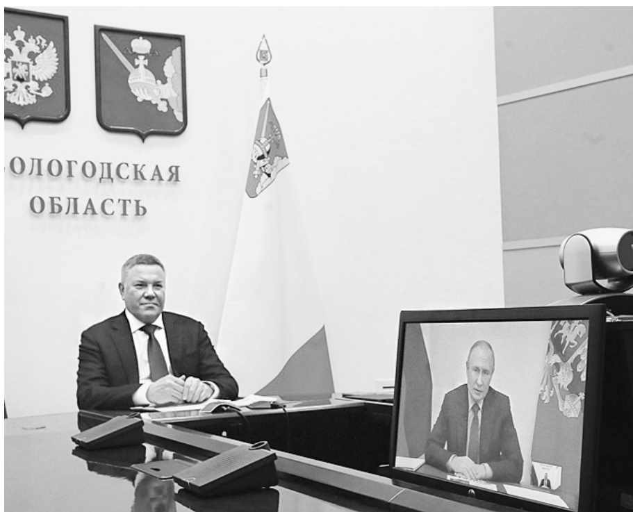
Владимир Путин: «Так и нужно, продолжайте. Люди должны чувствовать себя участниками этого процесса».

«Так и нужно, продолжайте. Люди должны чувствовать себя участниками этого процесса. Ни где-то там, по каким-то там основаниям принимаются градостроительные решения, а именно посоветовавшись с людьми. Мы много раз на этот счет говорили, и если у вас это на практике получается, это очень здорово», — подчеркнул Президент