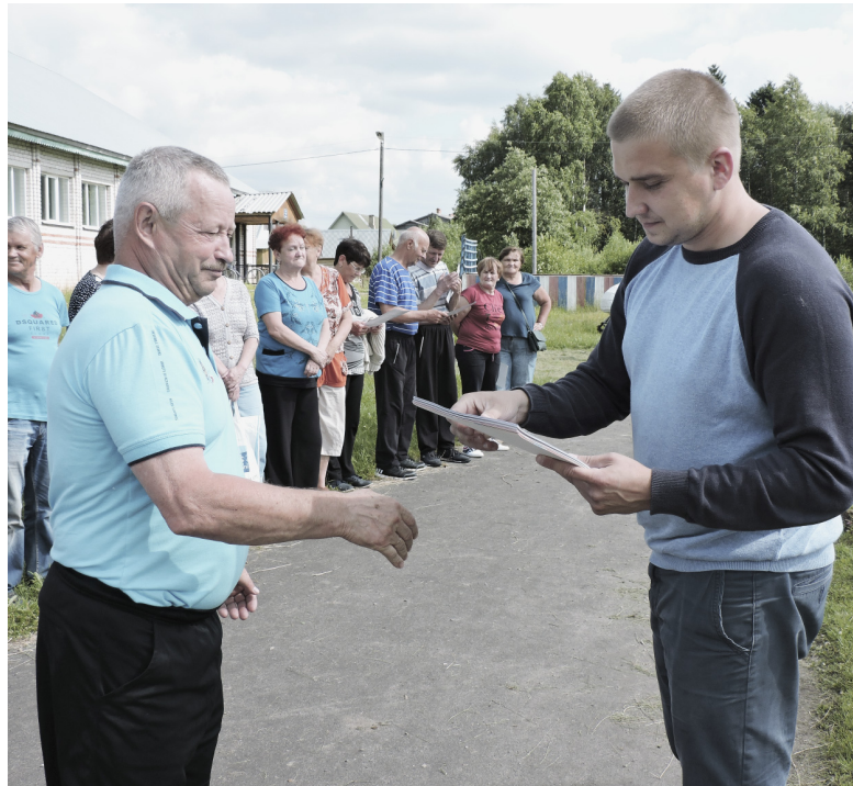
Кульминация мероприятия - церемония награждения.

Подготовила Алиса РАШЕВСКАЯ.