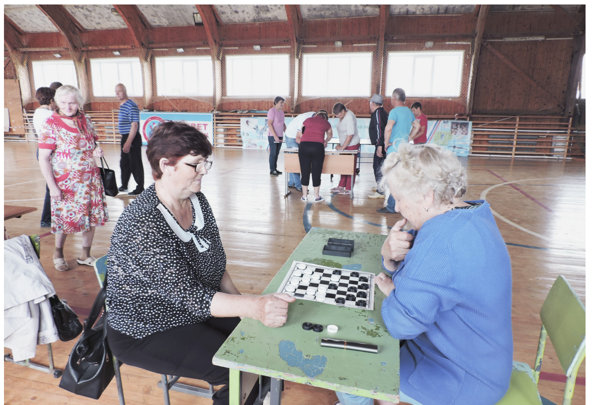
Шашки - логическая игра, требующая знаний маневров и комбинаций.