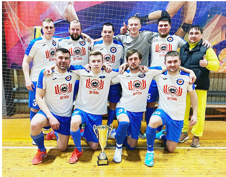
Сямженский «Ультрас» — обладатель Кубка города Сокола-2023.

- Давайте подробнее поговорим о недавнем Кубке города Сокола, который «Ультрас» выиграл. Изначально ехали за победой?