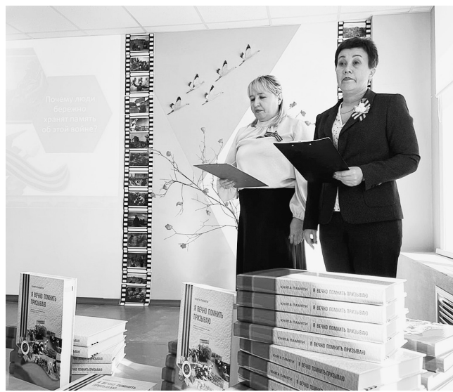
Презентация книги «Я вечно помнить призываю» состоялась в Гремячинской школе.

Были на мероприятии и представители подрастающего поколения. Юнармейцы Гремячинской школы прочитали стихи и исполнили песню. Это, пожалуй, один из самых важных моментов. Нет, не их выступление, а сам факт того, что ребята при-