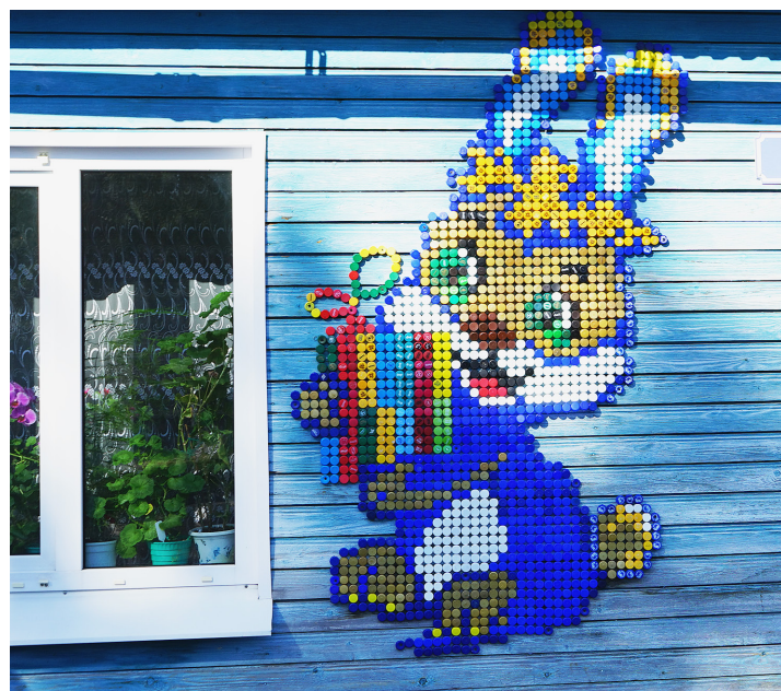
Невозможно без восхищения пройти мимо дома, украшенного такими милыми панно.