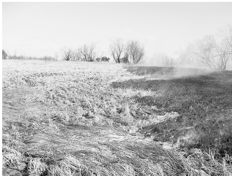
Пал сухой травы может привести к трагическим последствиям.

Мы не зря начали этот материал именно с пала прошлогодней травы. На территории Сямженского округа уже этой весной был случай возгорания сухой растительности на поле близ жилых домов. Вероятно, огонь начал распространяться из-за шалости подростков и брошенной спички или по невнимательности взрослых, которые беспечно бросили окурок в траву. Хорошо, что благодаря бдительности местных жителей удалось избежать распространения огня. Тем не менее данная ситуация вызывает опасения. Родители должны рассказать детям об опасности, которую таят игры со