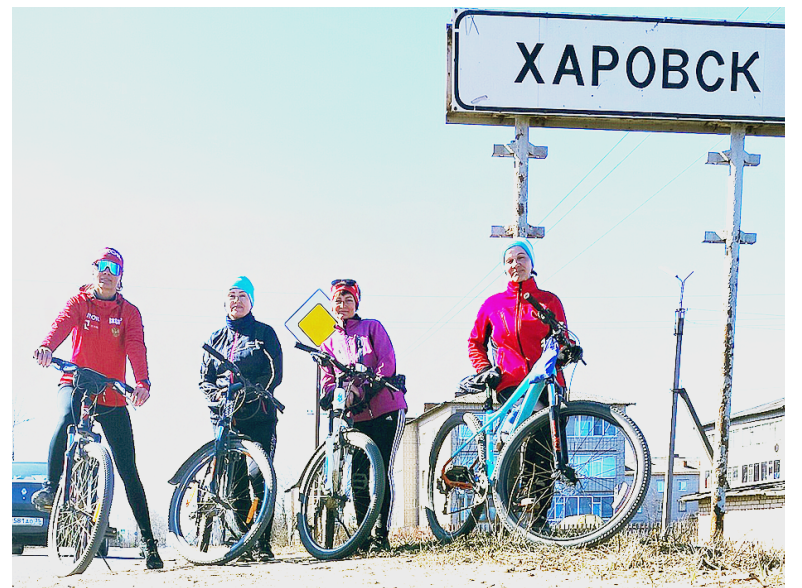
За 3 часа 46 минут сямженки преодолели 56 километров и 550 метров.

«Пока мы двигались по трассе, нас любопытными взглядами встречали жители местных деревень. Всем было интересно, куда же направляется целая группа велосипедисток. Когда