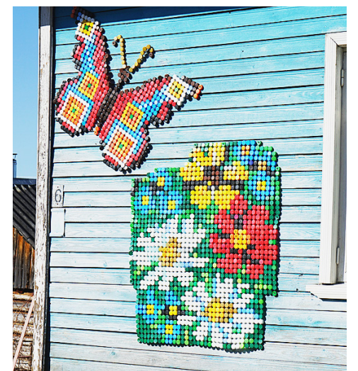
На квартире соседней также виднеется рукотворная красота.