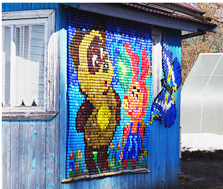
Самая большая работа — «Винни Пух и Пятачок». На нее ушло порядка 4000 крышек.