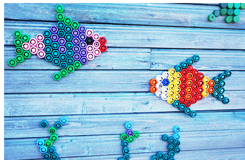
Из крышек от детского питания получились ажурные рыбки.

В своем творчестве Евдокия Викентьевна использовала уже более шес-