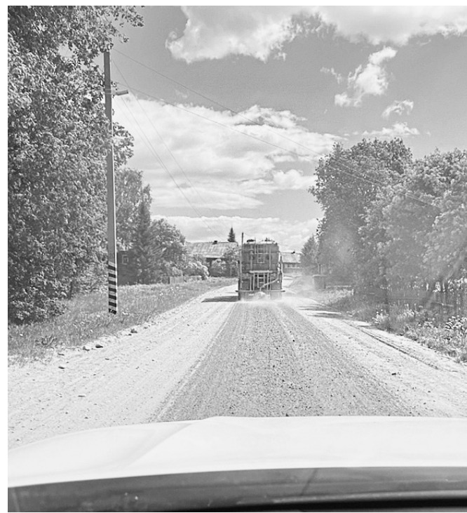
Работы по обеспыливанию дорог проводятся дважды за сезон.

К печати подготовил Дмитрий СМИРНОВ.