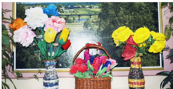
Цветы из гофрированной бумаги.