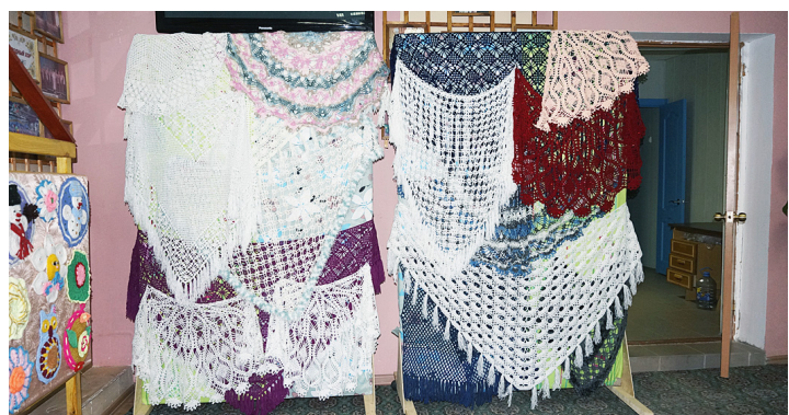
Изделия, вязанные крючком.