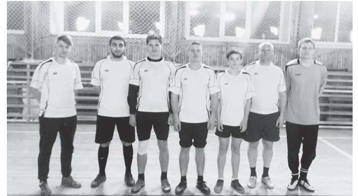
Команда "Лето" - победитель турнира.

Турнир открытия сезона по мини-футболу прошёл в ФОКе "Кристалл" первого декабря. Необычность его состояла в том, что не игроки выбирали команду, а команда - футболистов. Составы формировались по дате рождения спортсменов: "Зима", "Весна", "Лето" и "Осень". Не все любители футбола поддержали такую идею, не сформировалась команда "Весна". Но остальные участники с полной самоотдачей сражались за свои команды.