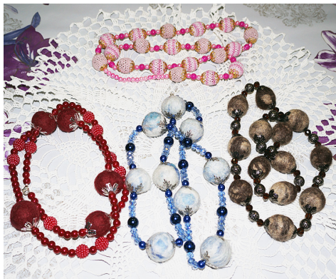
Бусы из вяленой овечьей шерсти.

"Мы, гости вашего села, обращаем внимание на выставки, которые проходят в