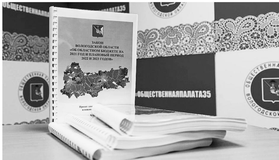
Зарботная плата работникам бюджетной сферы и социальные выплаты населению обеспечены в полном объеме. На особом контроле остаются вопросы реализации национальных проектов.

На особом контроле остаются вопросы реализации национальных проектов. Заключено контрактов на сумму 14,6 млрд рублей или 96% от