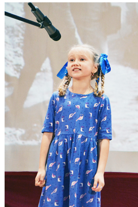
В исполнении ребят звучали трогательные стихи и песни военных лет.

Подводя итог этого дня, можно уверенностью сказать, что фестиваль «Будущее России» прошел продуктивно, динамично и познавательно. Он, несомненно, запомнился как участникам, так и организаторам этого патриотического мероприятия. После церемонии награждения уставшие, но довольные юнармейцы разместились в автобусах и отправились по домам. Ну а впереди ребят ждет еще много других, не менее интересных и значимых событий.