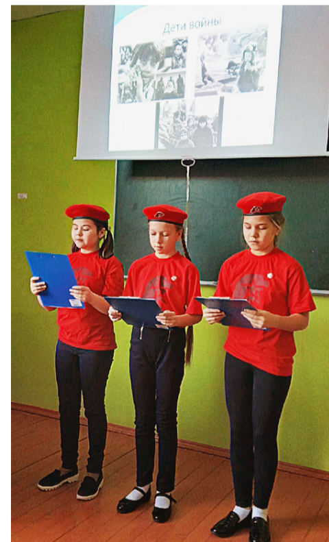
Также в рамках фестиваля в Доме Юнармии состоялась защита социальных проектов членов юнармейских отрядов и патриотических объединений Сямженского района.

Подготовила Екатерина ТИХОМИРОВА.