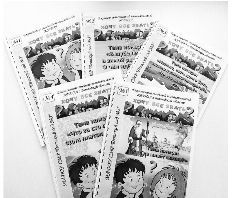
В течении пяти месяцев в создании журнала приняли участие 30 семей, 10 педагогов детского сада.

В процессе общей деятельности в этих проектах дети и родители приобрели творческие умения и навыки, новые увлечения, раскрыли креативные способности, а педагоги – вдохновение для продолжения совместного творчества и работы.