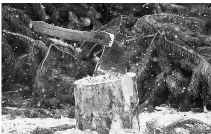
Заготовка гражданами новогодних елей (деревьев других хвойных пород) самостоятельно для собственных нужд действующим лесным законодательством не предусмотрена.

Предупреждаем, что за незаконную заготовку новогодних елей правонарушитель несет административную ответственность, которая предусмотрена статьей 8.28 Кодекса Российской Федерации об административных правонарушениях и влечет наложение административного штрафа на граждан до пяти тысяч рублей; на должностных лиц — до пятидесяти тысяч рублей; на