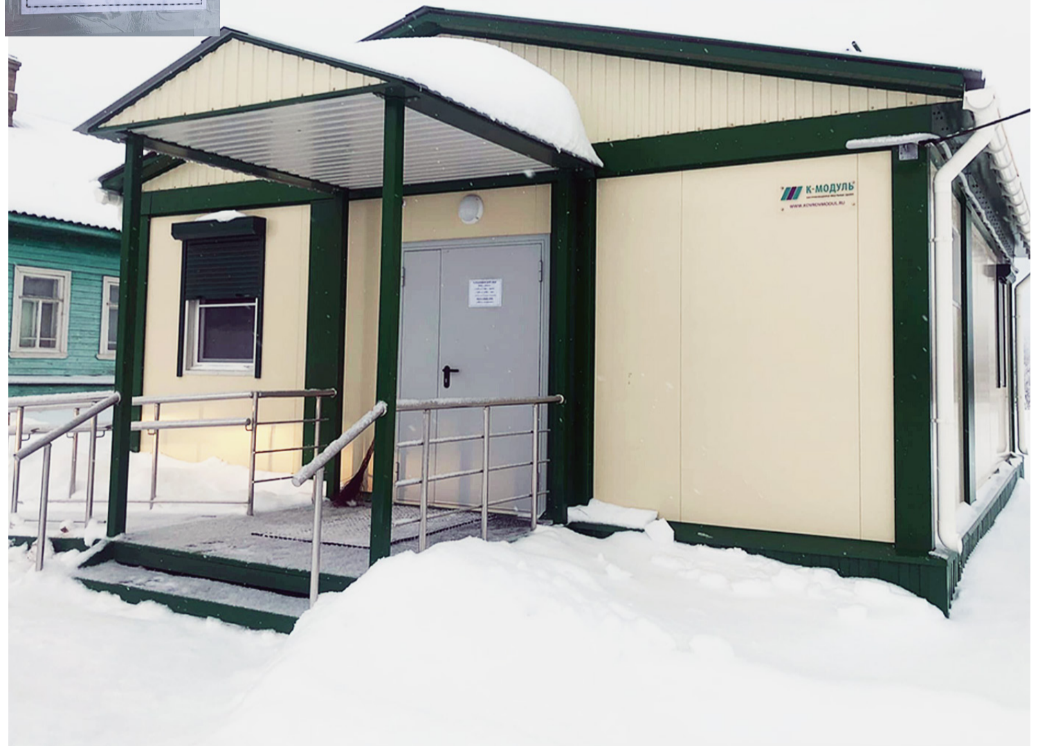
29 ноября новенький ФАП открыл двери для местных жителей.

на уколы. В минувший понедельник, например, утром было около 15 человек, посетители всегда есть», – говорят местные жители.