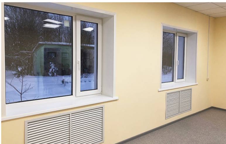
Совсем скоро в отремонтированное помещение переедет и библиотека. Этого с нетерпением ждут ее верные посетители.