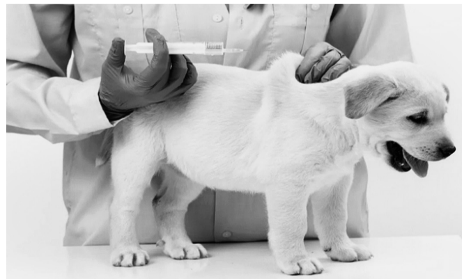
Для иммунизации домашних животных применяются такие антирабические препараты, как «Рабикан», «Дефенсер», «Нобивак Рабиес». Для вакцинации диких плотоядных животных в местах обитания раскладываются съедобные брикеты-приманки.

К слову, в нашем районе с 2017 года не было зафиксировано ни одного случая заболевания бешенством. Четыре года назад оно выявлялось сразу у двух животных — собаки и лисы. По данным на середину декабря, в ветеринарной станции привито от бешенства 437 собак и 141 кошка. Бесплатно провакцинировать своего питомца можно препаратом «Рабикан».