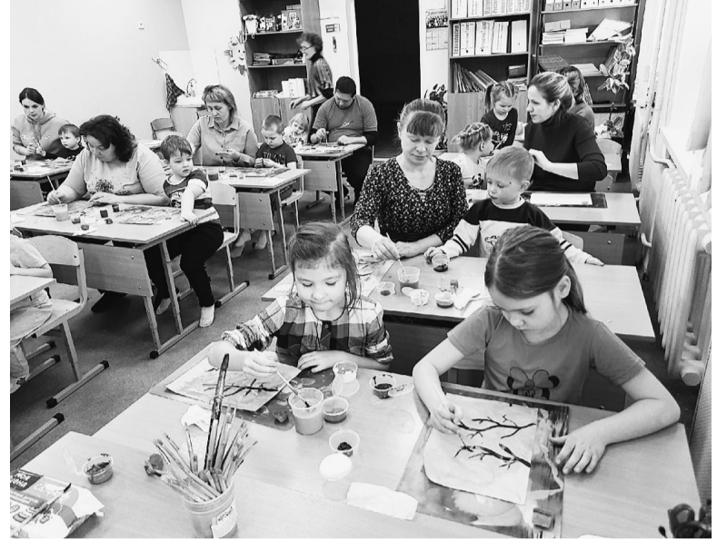
Дети и родители посещают занятия семейной творческой мастерской, где играют, общаются, приобретают новые умения и навыки в нетрадиционном изо-творчестве.

- «Понравилось, как организована работа. Занятия включают и игры, и непосредственно изодейательность. Педагоги видят всех детей,