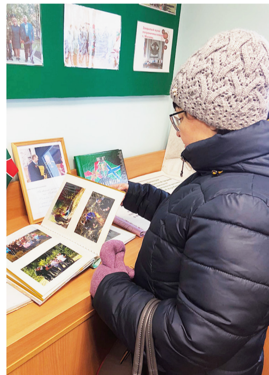
В здании учебного заведения располагается музей А.И. Коробицына, где в фото и документах представлена жизнь героя-земляка.