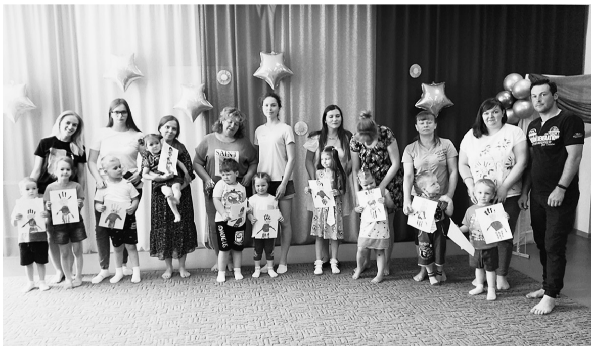
«Порой трудно разнообразить семейный досуг, но благодаря творческой мастерской «Северное сияние» мы не только развлекаемся, но и развиваемся».

- «Каждому найдется что почитать, а иногда и приготовить».