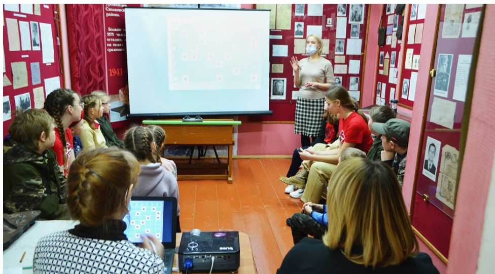
Во время интеллектуальной игры «Ворошиловский стрелок».