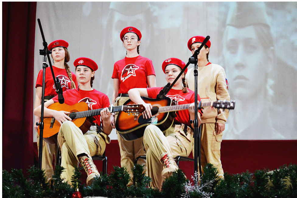
Присутствующим в зале были представлены литературно-музыкальные композиции в исполнении патриотических отрядов.