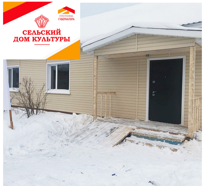
Режский ДК преобразился как внутри, так и снаружи: у здания отремонтированы фасад, крыша и крыльцо.

На этой неделе еще один ДК вновь открыл двери после капитального ремонта. В рамках реализации национального проекта «Культура» в филиале Режский сельский клуб БУК «Ногинский ЦК» был проведен большой комплекс внутренних и внешних работ. Несмотря на сменные сроки, заявленные виды работ: покраску стен, замену половых покрытий, окон, дверных проемов и дверей, монтаж подвесных потолков и нового освещения, ремонт и крылец, крыши и фасада выполнить удалось. Теперь в здании красиво, тепло и уютно. Что сразу оценили первые посетители. Ими стали местные жители и гости из районного центра. 14 декабря своими концертными номерами их радовали самодельные артисты и вокальный ансамбль «Вдохновение». Совсем скоро в отремонтированное помещение переедет и библиотека. Этого с нетерпением ждут ее верные посетители. В ДК и