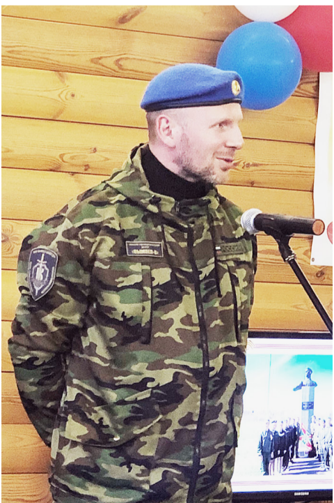
Гости поблагодарили организаторов проекта за радушный прием и проделанную масштабную работу, а такому важному и значимому делу, которым они занимаются, пожелали дальнейшего развития.