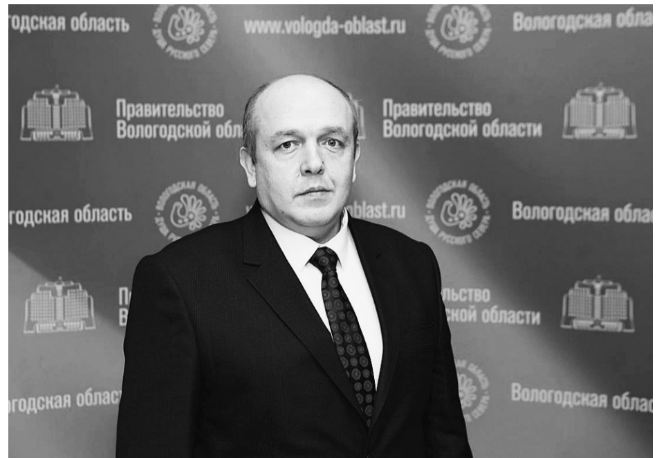
Алексей Плотников представил региональный план борьбы с коронавирусом с учетом возможного распространения на Вологодчине омикрон-штамма.

Обсерваторы разместят в Вологодском областном кожно-венерологическом диспансере №2 в Череповце, в Вологодском областном госпитале для ветеранов войн в Вологде и в Великом Устюге, на базе общежития Великоустюгского многопрофильного колледжа. В каждом из учреждений создадут по 50 мест. Губернатор