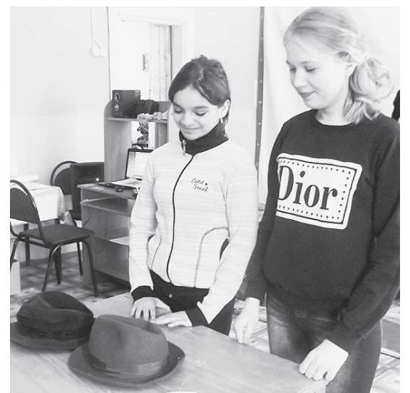
Конкурс "Где яйцо варится".