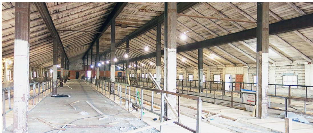
В планах фермера заполнить здание скотом уже к зиме.