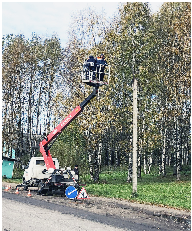
В сельском поселении Сямженское новым оборудованием было оснащено более пятидесяти опор, освещающих центральные улицы райцентра.

В начале текущего года Правительство Вологодской области выбрало муниципальные проекты, которые получат субсидии из областного бюджета в рамках программы "Народный бюджет".