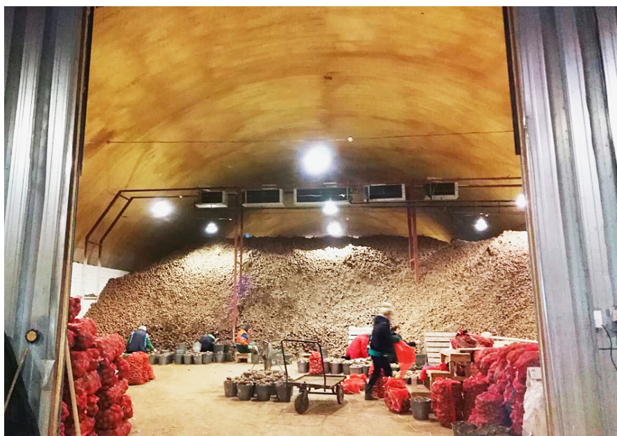
Овощехранилище в СПК "Вологодский".

В достижении цели все средства хороши. А лучший способ разобраться в не до конца изученном деле - обменяться опытом с коллегами, которые на этом, как говорится "собаку съели". Поездки сямженских фермеров в другие районы области с целью - посмотреть, как дела ведутся, кое-что полезное почерпнуть и в дальнейшем в своей работе применять - далеко не редкость.