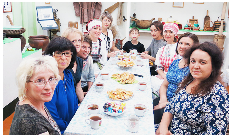
За работу и усердие Семёновна и Степановна угостили дорогих гостей вкусными капустными пирогами и душевным чаем!