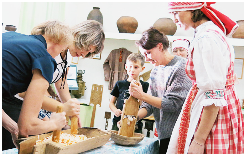
Гости помогли Семёновне на рубить и засолить капусту на зиму.

С давних времен осень отождествлялась со сбором урожая. А самым главным овощем на Руси считалась капуста. В минувшую пятницу, 12 октября, в краеведческом музее прошли "Капустные посиделки".