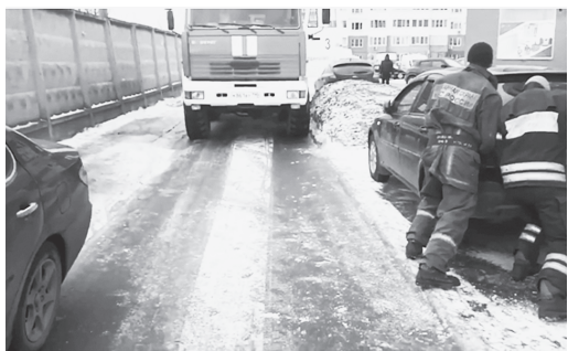
На фото пожарные не могут проехать к месту пожара из-за перекрытия проезда.

В последнее время один из насущных вопросов для экстренных служб - перекрытие проезда к зданиям и жилым домам.