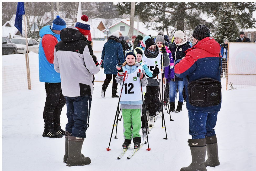
К старту готовятся юные лыжники.