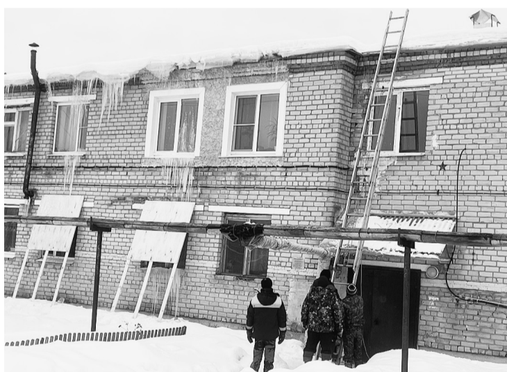
Специалисты Сямженского ЖКХ убирают наледь с крыши многоквартирного дома на улице Дорожной.

Зима в этом году выдалась довольно теплой, морозы пришли в начале января и почти сразу отступили. Порой погода больше походит на весеннюю, отсюда и благоприятные условия для образования опасных ледяных «наростов» на крышах домов, магазинов, предприятий — сосулек. Когда они небольших размеров, то на них практически никто не обращает внимания, но, когда над окнами нависают острые, как мечи, льдины, пора принимать меры.