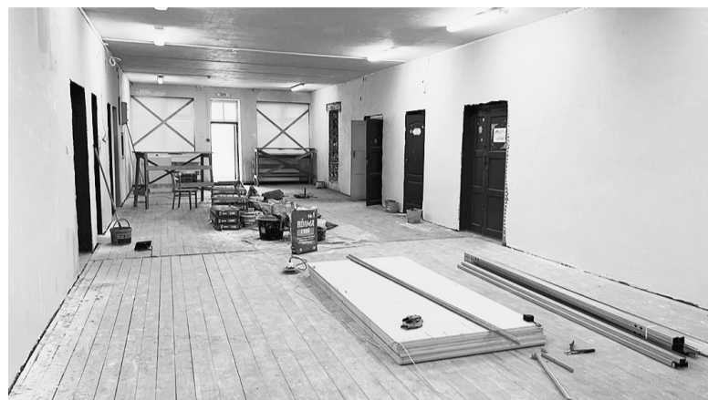
В рамках национального проекта «Культура» в 2022 году в Сямженском районе был отремонтирован Ногинский центр культуры.

В рамках нацпроекта «Производительность труда» уве-