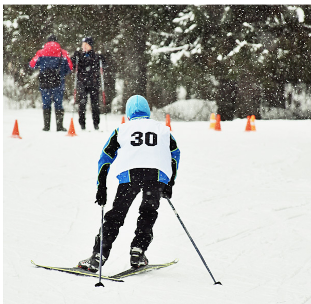
Характер и воля к победе закладываются у начинающих лыжников с ранних лет.