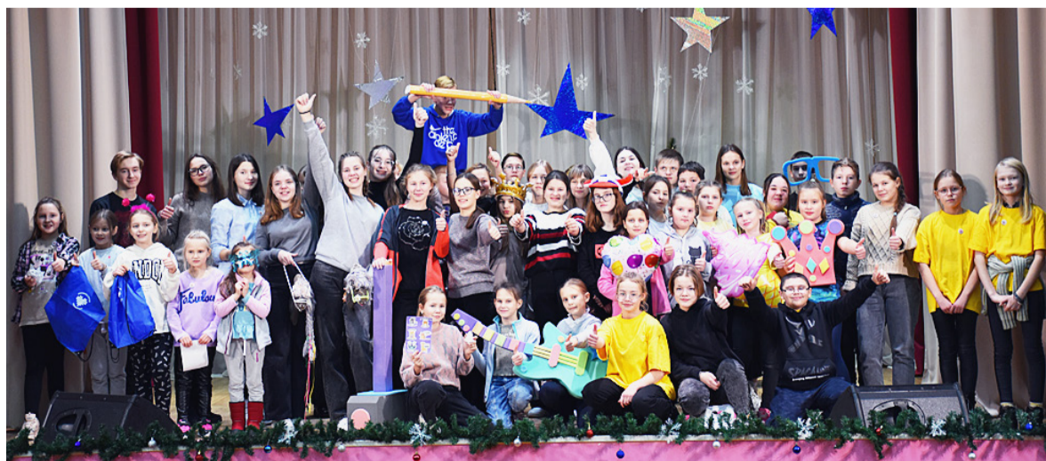
На слете волонтеров, состоявшемся в РЦК, собрались добровольцы всех отрядов района.