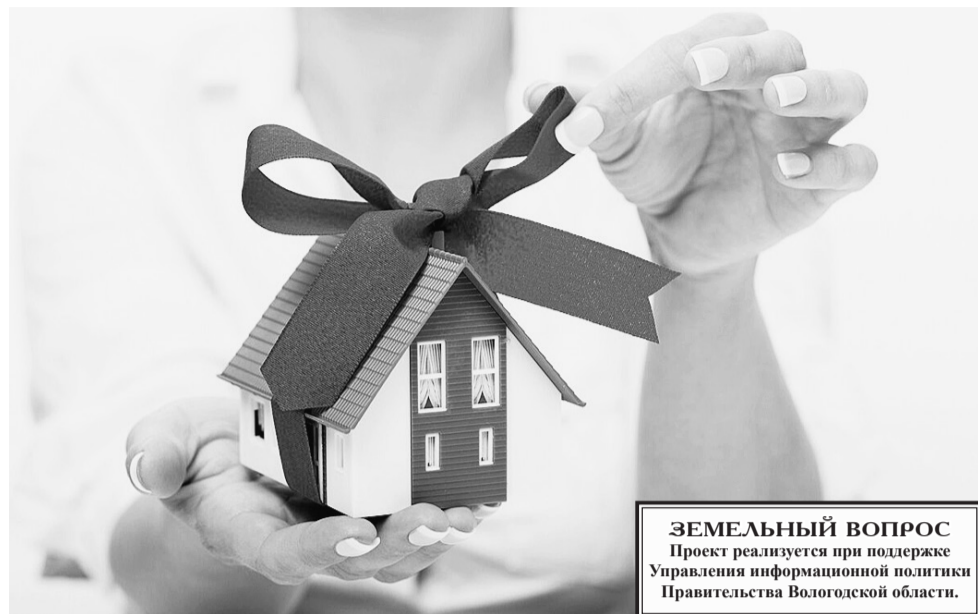
ЗЕМЕЛЬНЫЙ ВОПРОС Проект реализуется при поддержке Управления информационной политики Правительства Вологодской области.

«Переход права собственности по договору дарения недвижимого имущества подлежит государственной регистрации, а завещание согласно статье 1124 ГК РФ должно быть по общему правилу удостоверено нотариусом, в особых случаях завещание может быть удостоверено лицами, перечисленными в статье 1127 ГК РФ. Оформление прав наследников на недвижимое имущество осуществляется на основании