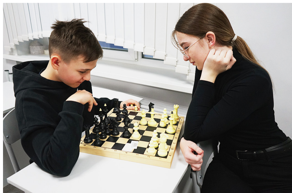
Инфраструктура центра используется и во внеурочное время.