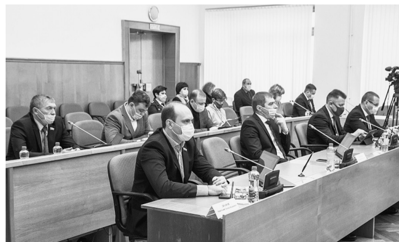
За три года на реализацию народных инициатив будет направлено порядка 15 миллиардов рублей.

«Что касается основных цифр на 2022 год, то доходы составят 106,6 миллиарда рублей, расходы — 110,1 миллиарда, дефицит — 3,5 миллиарда рублей, и он полностью обеспечен остатками средств с прошлого года, — отметил спикер ЗСО. — Если говорить об отдельных сферах, то социальная политика получит 30,2 миллиарда рублей, образование — 22,2 миллиарда, дорожный фонд составит 18,7 миллиарда рублей, здравоохранение будет профинансировано на уровне 10,1 миллиарда. Кроме того, поддержка сельского хозяйства составит 3,5 миллиарда, сферы культуры и спорта получат по два миллиарда рублей».