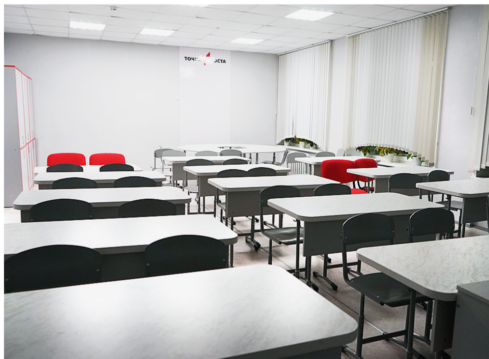
Центры «Точка роста» оформляются в едином стилистическом решении.

СОЦИАЛЬНАЯ ПОЛИТИКА Проект реализуется при поддержке Управления информационной политики Правительства Вологодской области.