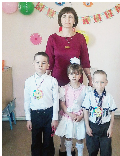
Выпускники дошкольной группы.

Самые красивые, самые счастливые, самые-самые. И впрямь выпускники на высоте. Потому что дошли, потому что достигли, смогли! Вроде бы пришли к цели, окончили школу, остаётся только сдать экзамены. Но на душе почему-то печально. И как тут не расплакаться?