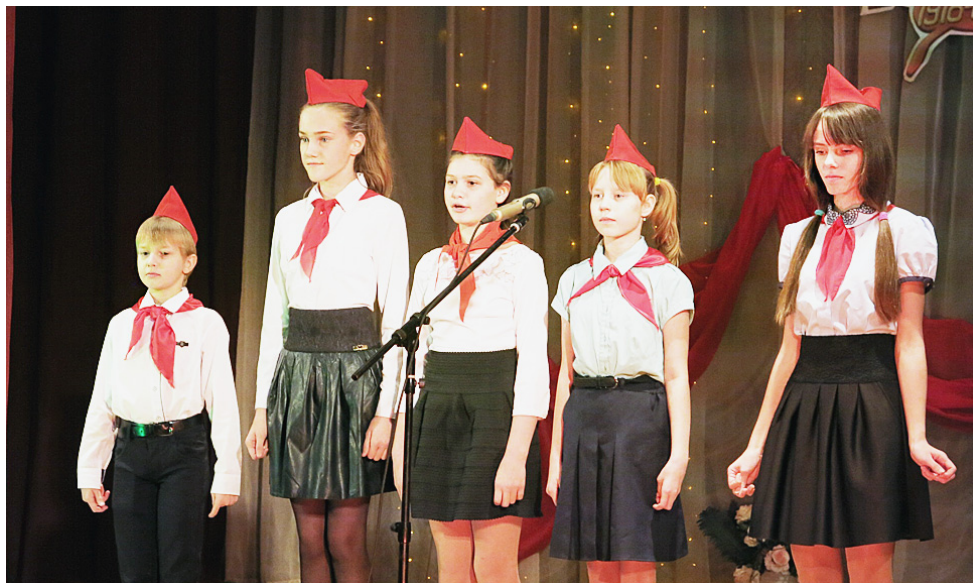
В концерте приняло участие и подрастающее поколение.

Отправившись в путешествие по страницам Ленинского комсомола, вспоминая основные этапы и важные события целой эпохи в истории нашего государства, комсомольцы-сямженцы поделились личными воспоминаниями о своей комсомольской юности: как вступали в комсомол, как работали, чем жили и о чём мечтали... Каждый из выступающих с теплотой и добрым словом вспоминал комсомольские годы, ведь жизнь тех лет была насыщенной, интересной, увлекательной и живой.