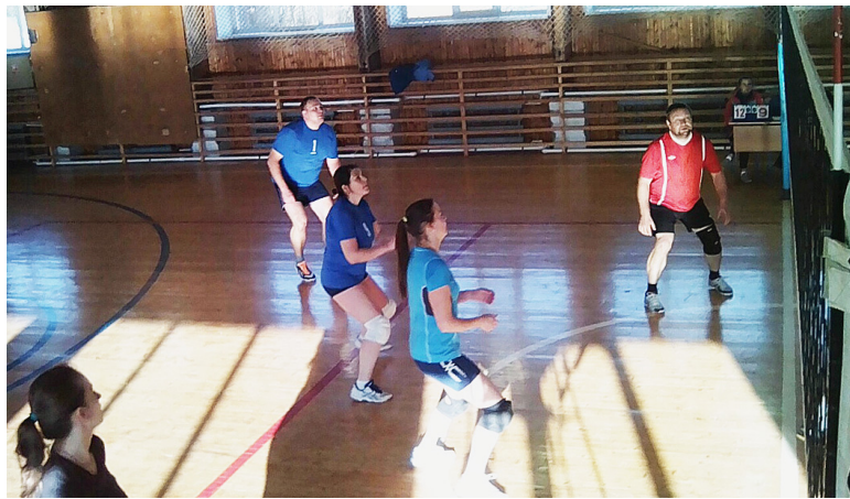
Во время игры.

Во второй группе "Сямжа-2" не смогла оказать достойного сопротивления сильным составам из Кадникова и Грязовца, уступив со счетом 0:2. Зато команды "Грязовец" и "Кадников" бились до последнего за право играть в финале турнира. Сначала казалось, что ребята из Грязов-