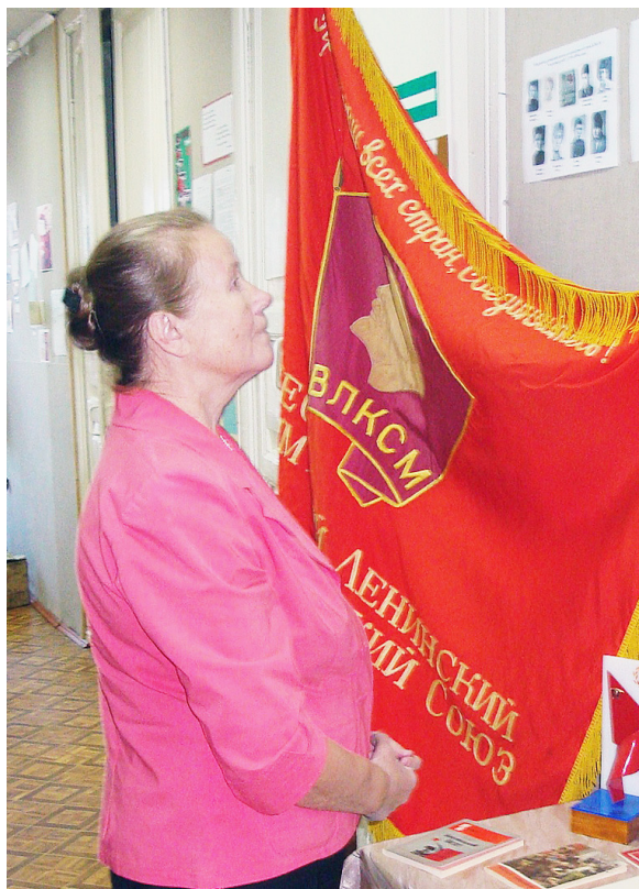
По завершению встречи все желающие могли посмотреть выставку "Юность комсомольская моя".