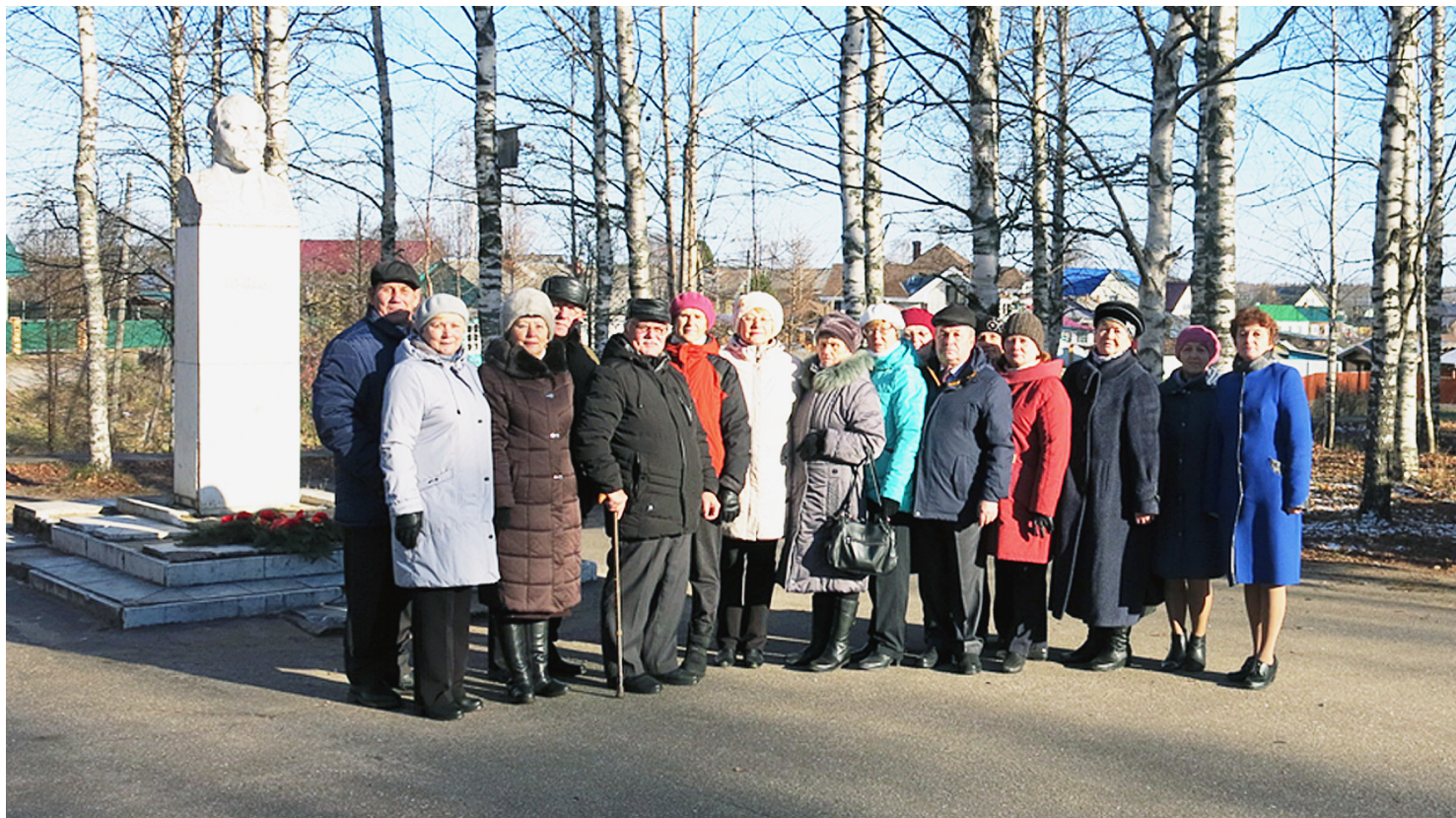
Фото на память.

Комсомол внес значительный вклад в развитие молодежного движения, в формирование патриотизма, социально ответственного поведения, гражданской и политической активности у советских граждан. Несколько поколений молодежи в течение многих десятилетий существования комсомольской организации трудились во имя экономического и социального могущества нашей страны.