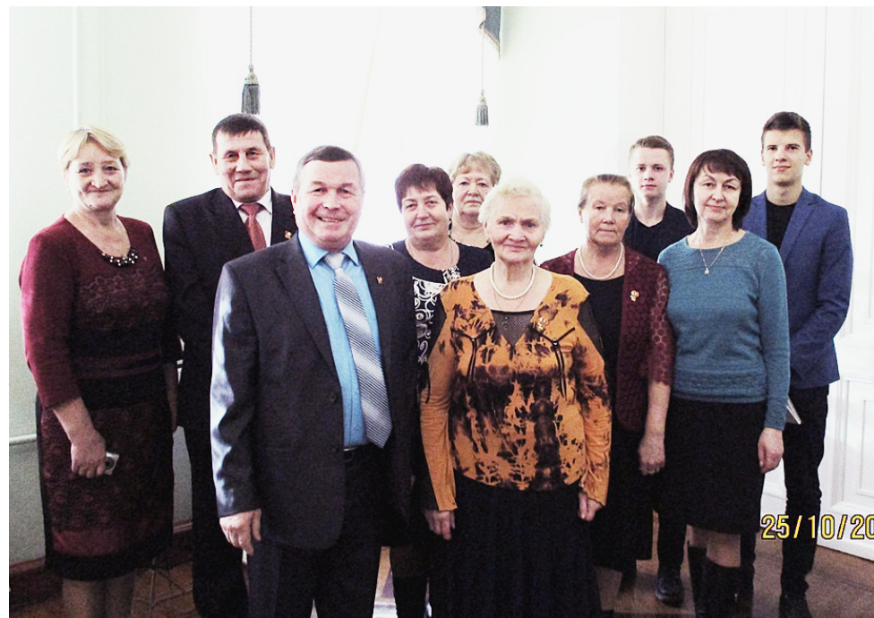
Делегация Сямженского района.

продолжились в Вологодском областном ордена "Знак Почета" драматическом театре. В фойе играл духовой оркестр, а также была развернута выставка, в фотографиях которой запечатлены этапы большого пути Ленинского комсомола.