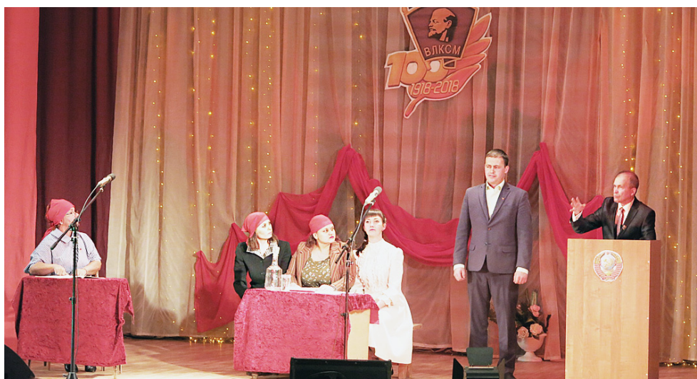
Комическая сценка в исполнении артистов РЦК.