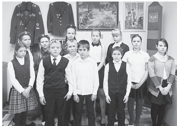
По материалам с сайта Коробицынской основной школы к печати подготовила Любовь ТИХАНОВА.

В этот день прошло торжественное вступление в ЮДП новых ребят. Отряд пополнился тринадцатью новыми членами. Поздравляем и желаем им не посрамить имя героя-пограничника.