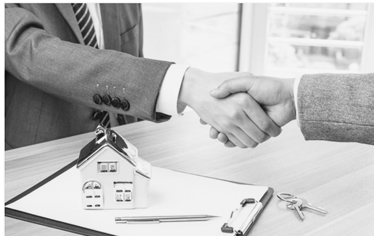
Необходимым условием дистанционной сделки с недвижимостью является нахождение одного из выбранных нотариусов в регионе, где находится отчуждаемый объект недвижимого имущества.

Отмечу, что участие нотариуса в сделках с недвижимостью служит гарантом безопасности и законности прав участников, поскольку при совершении подобных процедур нотариус не только проверя-