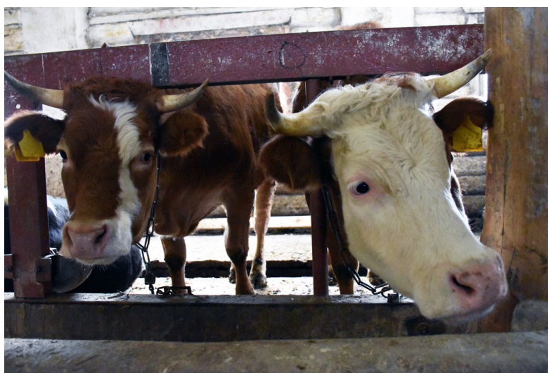
Кудрявые красавицы породы «Лимузин».