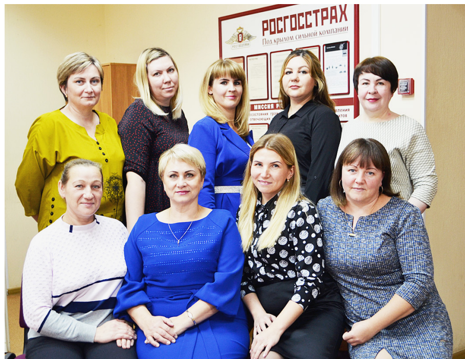
Коллектив Агентского центра «Сямженский».

Страховать недвижимость или нет? Ответ на этот вопрос может дать только собственник жилья. В сводках МЧС периодически появляется информация о пожарах, паводках или ураганах; в сводках МВД — о кражах