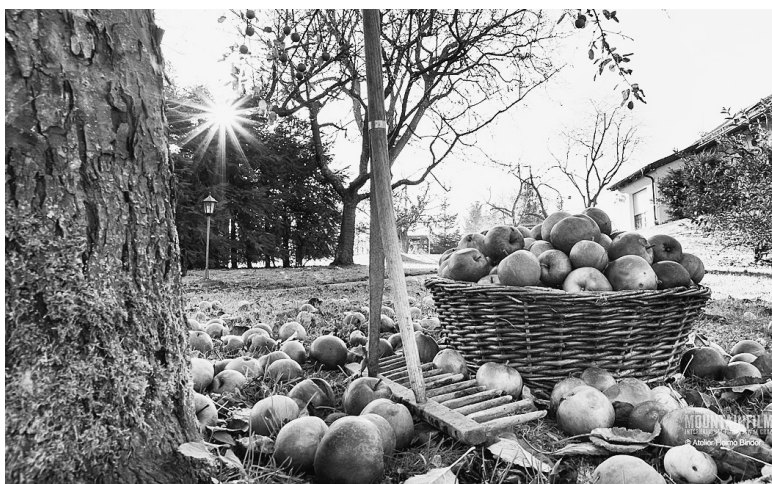
Октябрь — время уборки яблок и груш поздних сортов.

В них зимуют вредители и возбудители болезней. Незагущенные кусты красной смородины плодоносят 15–20 лет, черной — 5–6 лет, крыжовника — 5–8 лет. После этого целесообразно полностью обновлять насаждения. Земляника дает хорошие урожаи ягод в течение двух лет. На третий год уро-