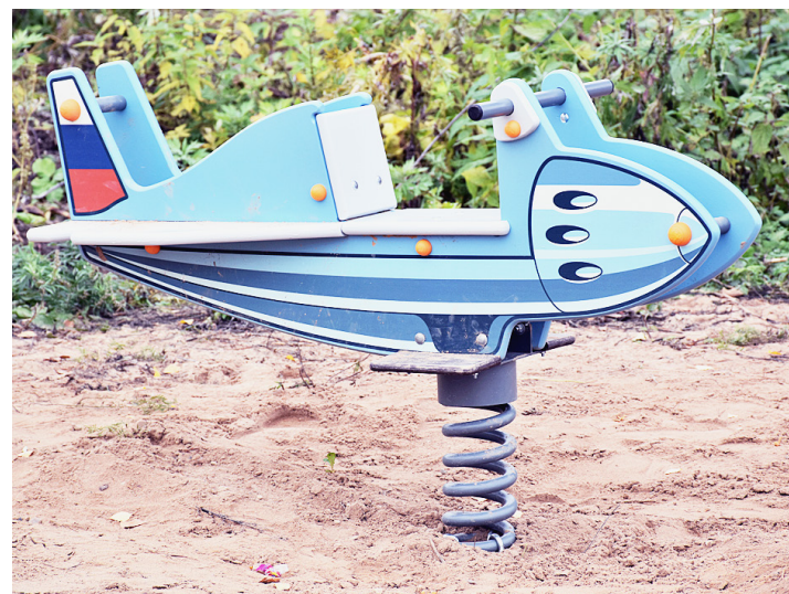
Качель для самых маленьких — «Самолет».