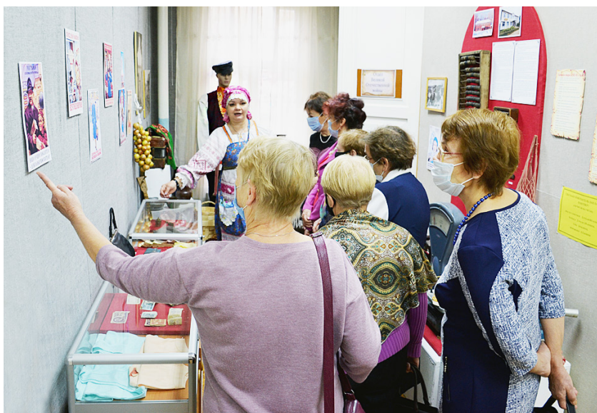
Новая выставка рассказывает об истории торгового дела.

Подготовила Екатерина ТИХОМИРОВА.