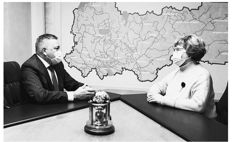
Уже на протяжении года в Вологодской области работает приемная Уполномоченного по защите прав ветеранов и пенсионеров.