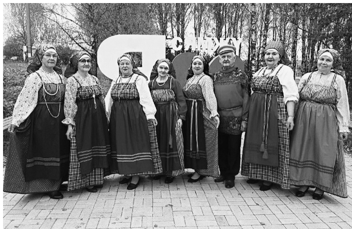
На изготовление костюмов для артистов было потрачено 100 тысяч рублей.

«Хорошие сценические образы, выполненные в едином стиле, помогают исполнителям держать требуемый