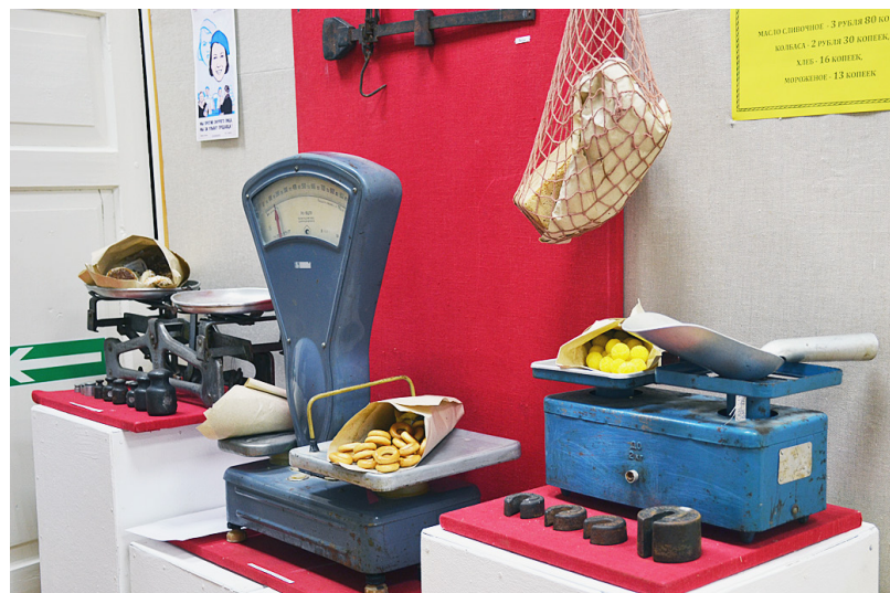
На экспозиции представлены экспонаты из фондов Сямженского музея.

Реклама. Объявления. Поздравления. Тел. 8(81752) 2-14-65.