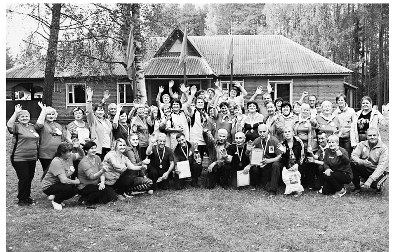
В 2023 году туристический слет среди ветеранов состоится в пятый раз.

Екатерина ТИХОМИРОВА.