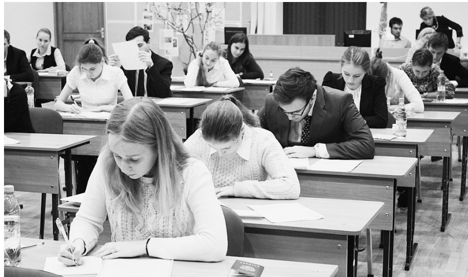
Самым массовым экзаменом в форме ЕГЭ остается русский язык. Его результаты требуются для получения аттестата и для поступления во все вузы Российской Федерации.

Все экзамены проходят в пунктах проведения экзаменов, организованных на базе школ области. В ППЭ выделяются кабинеты, оборудованные техническими средствами и видеона-