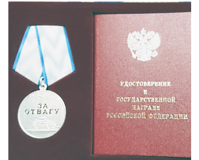
За мужество, проявленное в боях, земляк награжден медалью «За отвагу».