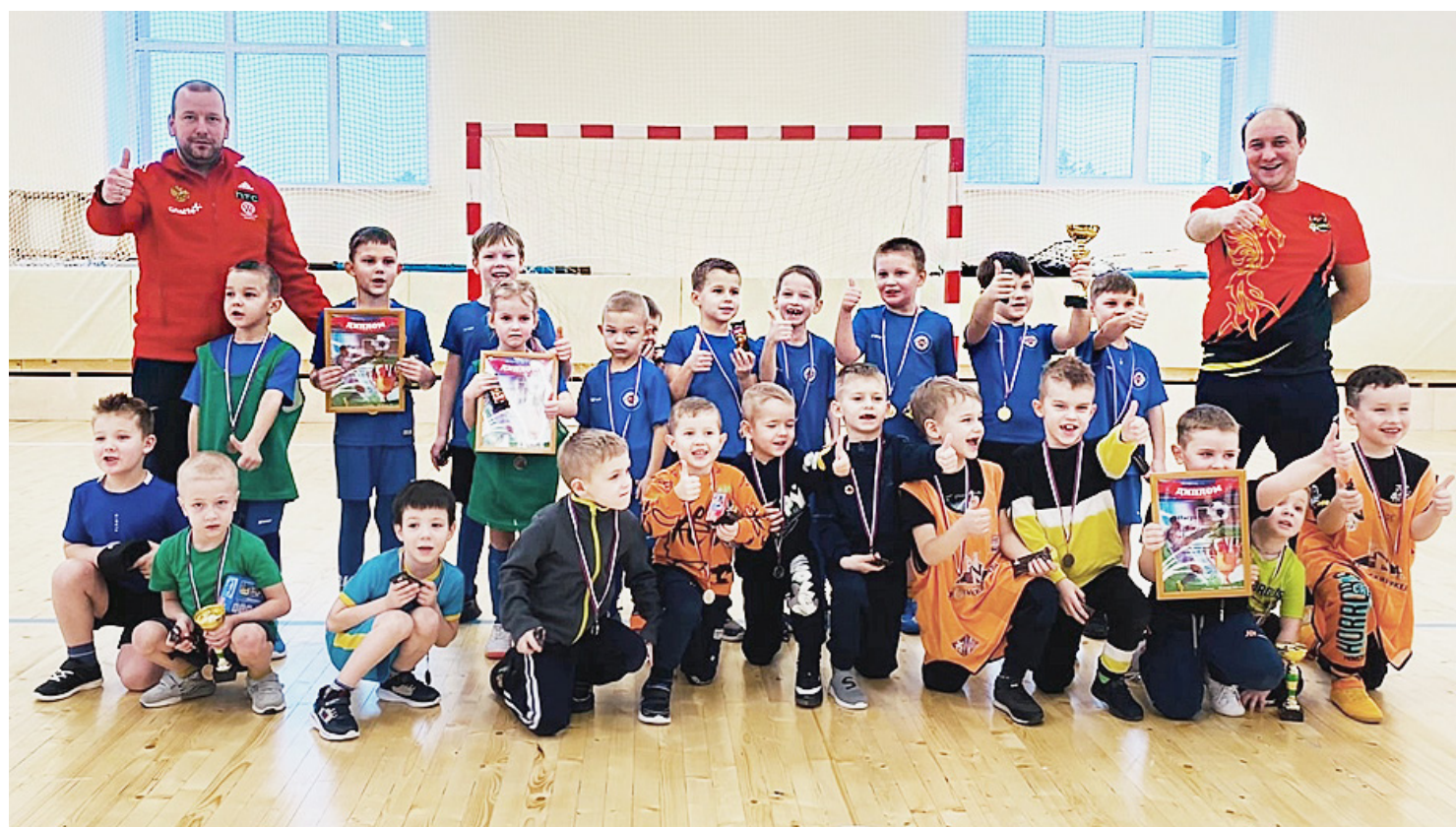
На межмуниципальном турнире по футболу среди мальчиков 2016-2017 гг. в Сямже.