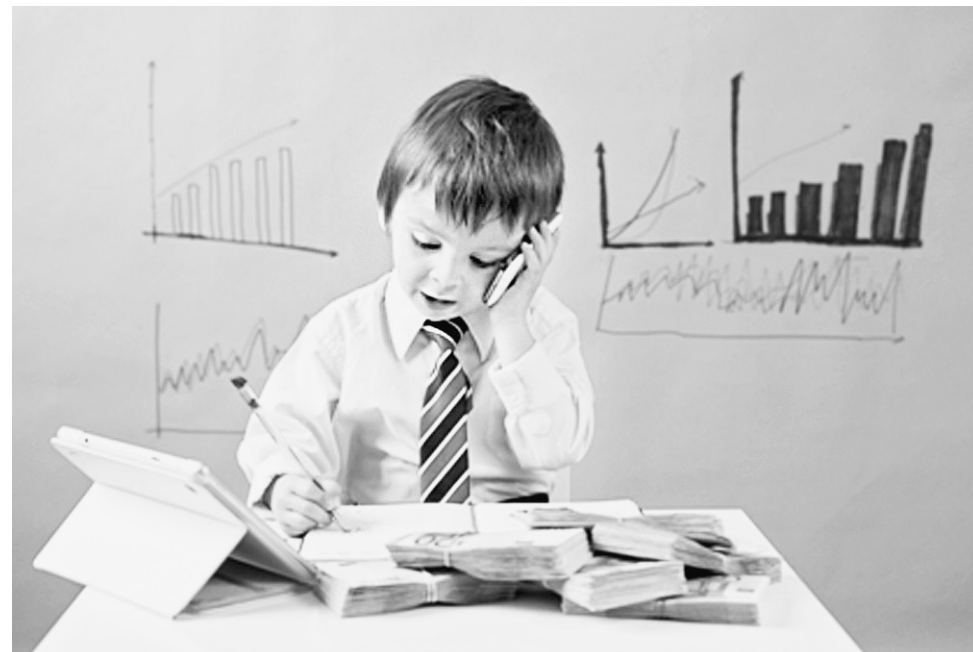
Важно знакомить детей с финансово-экономическими отношениями как можно раньше, начиная с 5-6 лет.