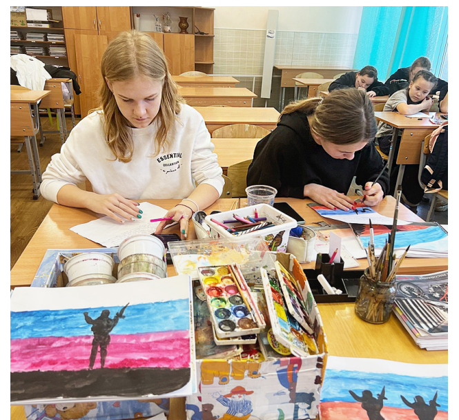
В каждом послании огромная благодарность за отвагу, мужество и героизм.