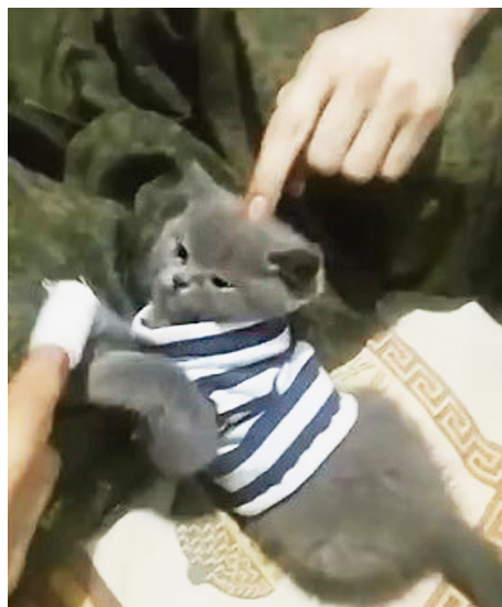
Пушистый «боец» явно чувствует себя как дома.

Говорят, что песня и строить, и жить помогает. На передовой в зоне проведения специальной военной операции на Украине тоже, кстати, так. Нередко мы видим в социальных сетях, как наши военные исполняют красивые произведения, зачастую сами себе аккомпанируя. Но не только музыкой единой летят души защитников Отечества. Относительно недавно на просторах интернета появился забавный ролик, где солдат играет с котенком.