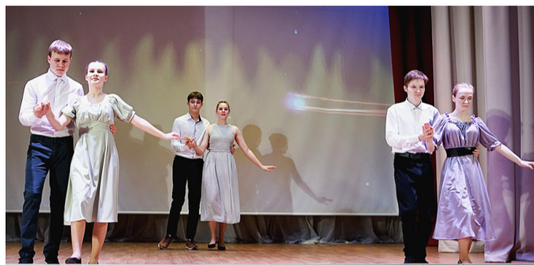
Коллектив участников концертов насчитывает двадцать активных, талантливых и артистичных детей.