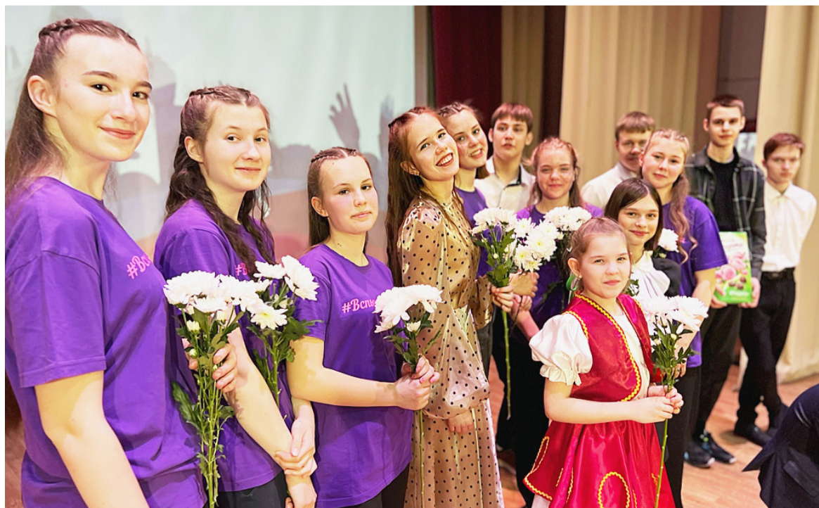
Во всех уголках Сямженского округа благотворительные концерты «Вспышки» были встречены на «ура».

Екатерина ТИХОМИРОВА.