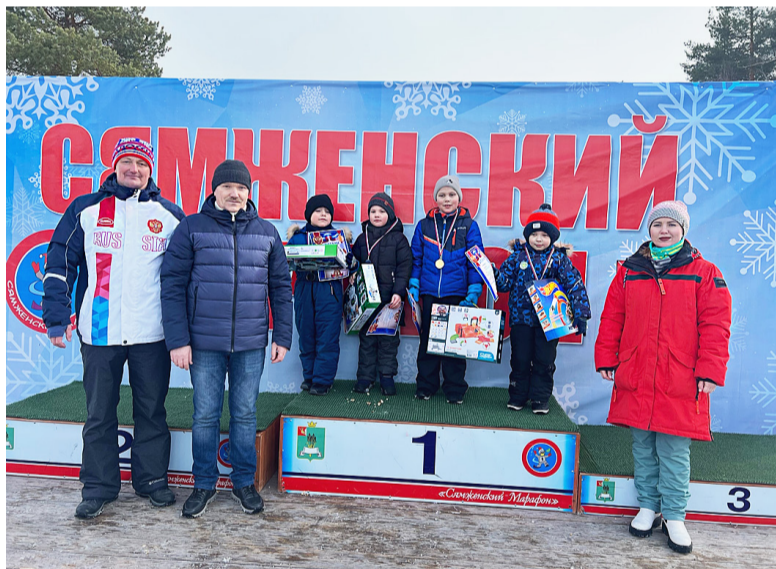
Все мальчишки и девчонки здорово справились с гонкой, но лучше всех это сделали воспитанники Детского сада №1.