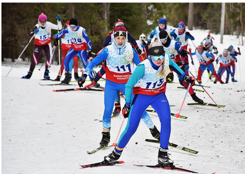
На подъемах спортсмены тратили много сил, но именно здесь можно было отыграть драгоценные секунды.