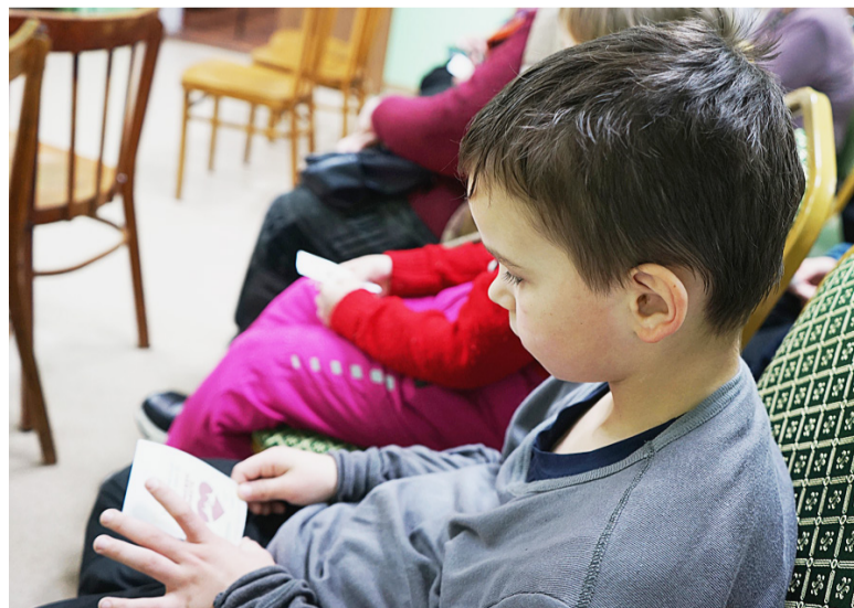
Юный зритель концерта «Поможем вместе».