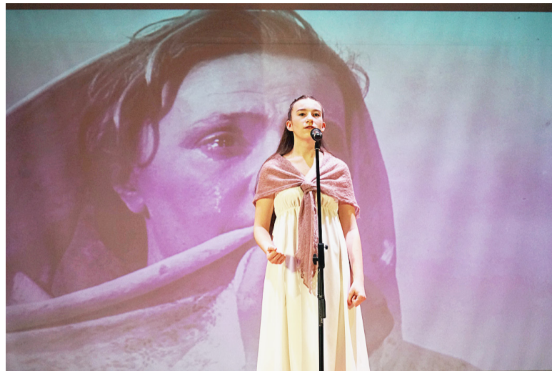
Зрители не сдерживали слезы от прочитанных артистами произведений.

«Пятого февраля жители нашего поселка Ширега посмотрели благотворительный концерт в Гремячинском центре культуры. Зрительный зал был полон. Пришли люди старшего поколения, родители с детьми, молодежь. В концерте участвовали творческие, артистичные ребята. Звучали стихи и песни о любви к Родине. Красивые танцы, трогательные и народные ме-