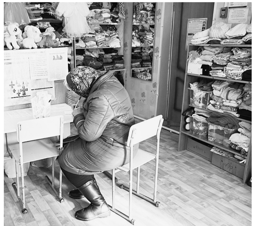
Лавку социальной помощи посещают все слои населения. Здесь есть и детские вещи, и взрослые, и подростковые.

«Магазин социальной помощи востребован среди малоимущих граждан. Здесь очень большой выбор. Мы рады, что он появился в Сямже», — напи-