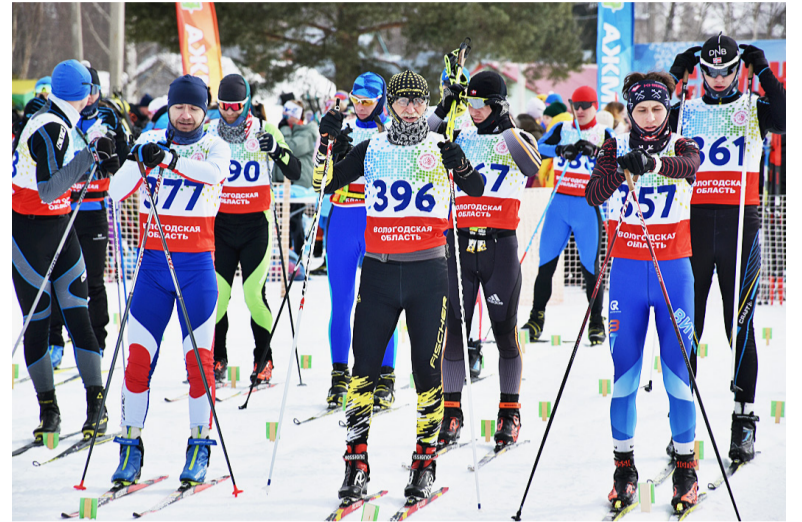
Всегда именно масс-старт являлся одним из самых зрелищных видов соревнований.

Пока лыжники со стажем разбирались на длинных дистанциях, на стадионе по традиции состязались наши юные таланты – воспитанники детских садов. Тридцать будущих чемпионов выявляли лучших на двухсотметровом круге. Здесь, как полагаются, за своих подопечных переживали воспитатели, и, конечно, с особым трепетом болели за малышей родители. На столь большом спортивном празд-