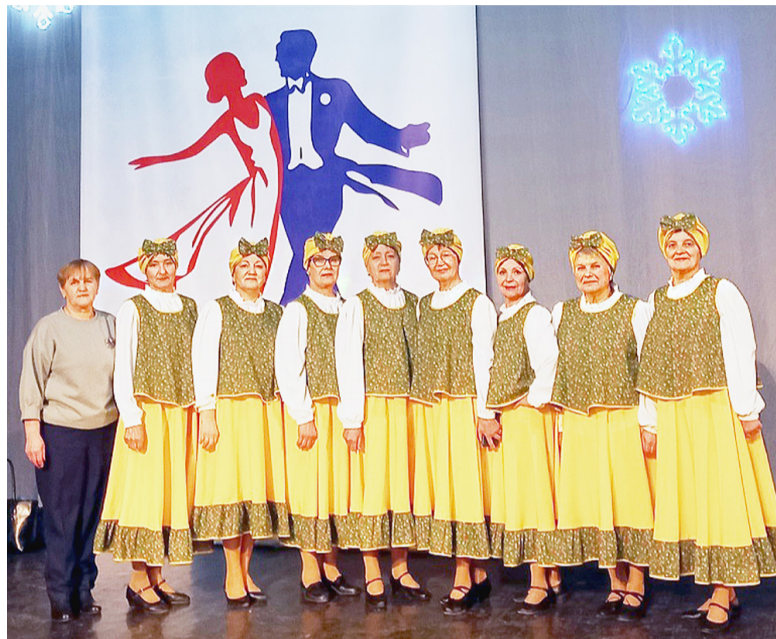
Яркие костюмы, разнообразие танцевальных элементов, правильно подобранная музыка позволили нашим артистам раскрыть задуманный образ «Деревенские гулянья».

«Ноябрь 2022 года был знаменателен для культурной жизни села: по инициативе председателя районного Сове-