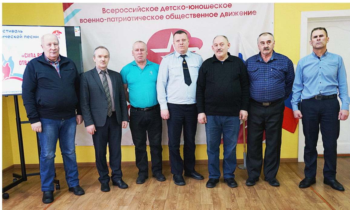
На мероприятии присутствовали сямженские воины-интернационалисты.

«Очень приятно приветствовать сегодня в этом зале как юное поколение патриотов, так и умудренных опытом мужчин, которые принимали участие в военных операциях. Действительно, у нашей страны есть богатый опыт защиты своего Отечества. Достаточно вспомнить годы Великой Отечественной войны, когда советский народ выстоял и победил. Это и Афганская, и Чеченская войны. К сожалению, и сегодня спецоперация на Украине продолжается, но мы уверены, что наше дело правое, и победа