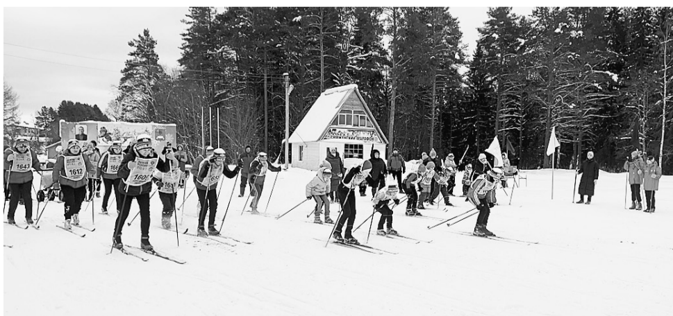
На старт вышли около ста участников.