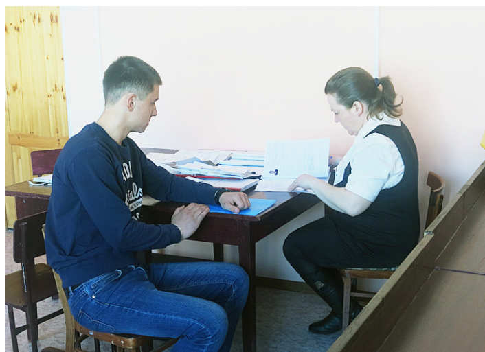
В личном деле призывника содержится вся важная информация о нем.