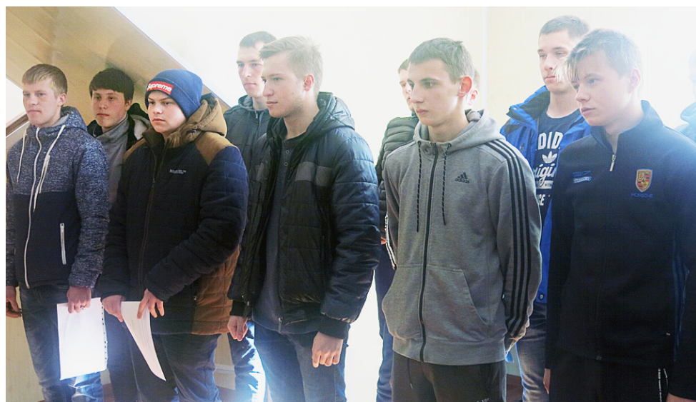
В ходе инструктажа.

На территории области работают 14 военных комиссариатов, в которых трудятся около 500 человек. Ежегодно через них проходят более 15 тысяч призывников. Только в 2017 году из Вологодской области отправлены в Вооруженные Силы более 3 тысяч человек, заключили