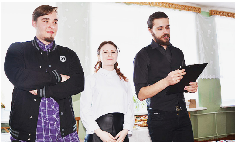
Студенты-второкурсники интересно, эмоционально и выразительно раскрыли присутствующим содержание данного словаря.