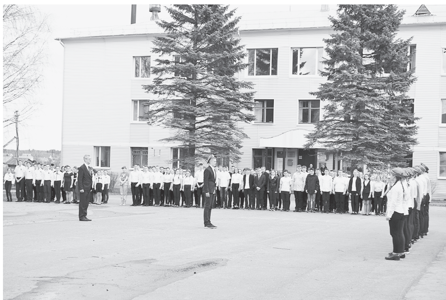
"Смотр строя и песни", приуроченный к празднованию Дня Победы.