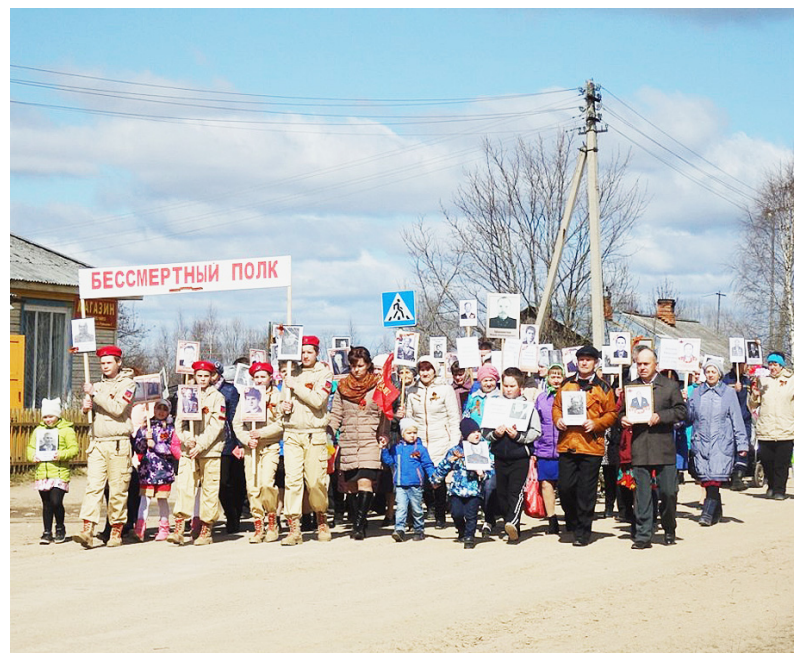
Бессмертный полк в деревне Самсоновской.

Праздничный митинг в сельском поселении Двиницкое по традиции начался у здания школы. К десяти часам здесь собрались жители и гости Двиницы. Они пришли с портретами своих отцов, матерей, дедов и прадедов, тех, кто сражался на фронтах Великой Отечественной и трудился в тылу.