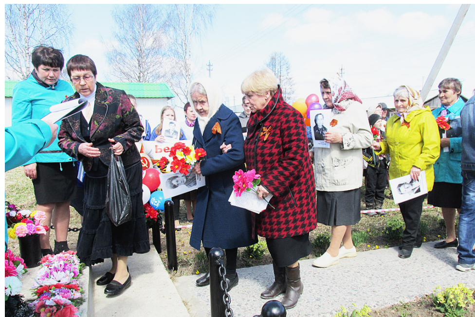
Возложение цветов к мемориалу в посёлке Гремячий.

9 мая в посёлках Ширега и Гремячий, в деревне Раменье прошли акции "Бессмертный полк" и торжественные митинги. В посёлке Ширега после митинга в